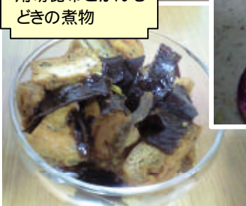
角切昆布とがんと どきの煮物