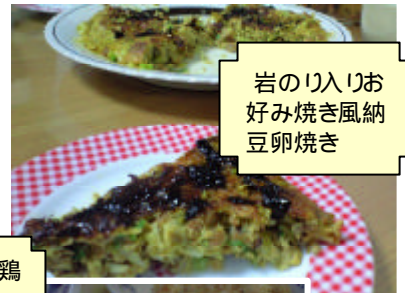
岩のり入りお 好み焼き風納 豆卵焼き