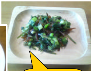
生姜こんぶの韓 国風ネギサラダ