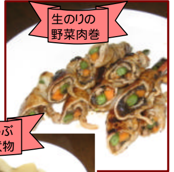
生のりの 野菜肉巻