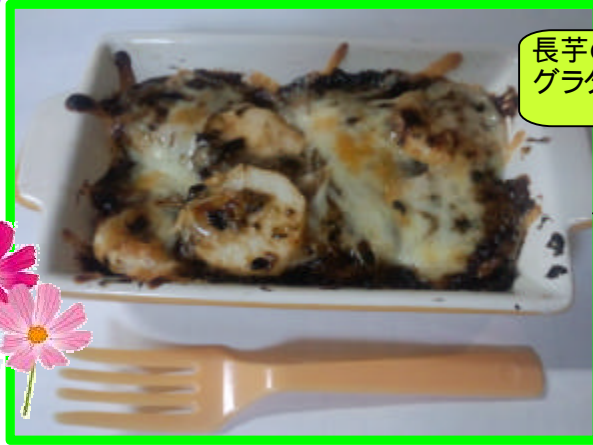
長芋の生のり グラタン