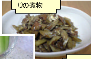
ごぼうとあさ りの煮物