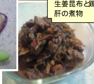
生姜昆布と鶏 肝の煮物