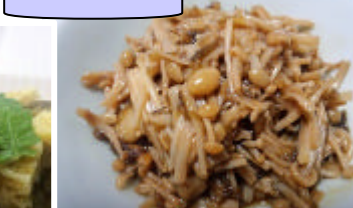
生のりの えのきなめこ風