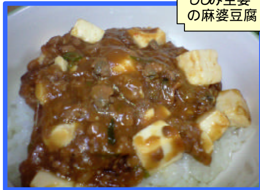
しじみ生姜 の麻婆豆腐