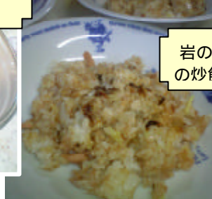
岩のりとツナ の炒飯