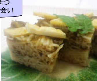
生のりとそう めんの出会い