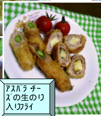
アスパラチー ズの生のり 入りフライ