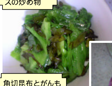
しそ若布とレタ スの炒め物