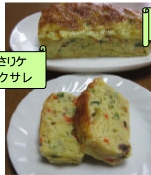
あさりケ ークサレ