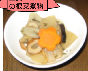
生姜こんぶ の根菜煮物