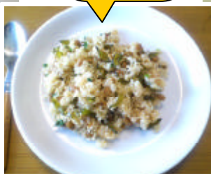
しそ若布の 納豆チャーハン