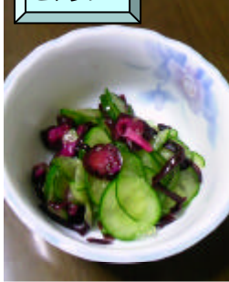
しば漬け きゅうり