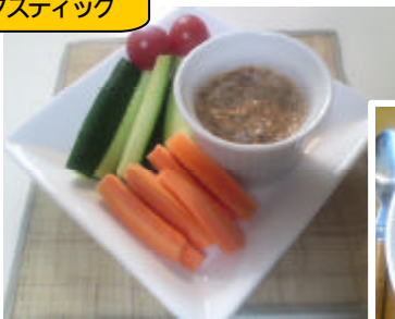
岩のりのサラ ダスティック